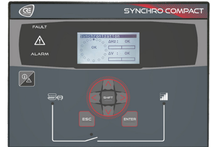
VERSIÓN CON PANTALLA PARA MONTAJE EN TABLERO DE CONTROL